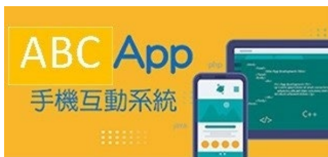
圖 5.3a 「校本流動應用程式 App」示例