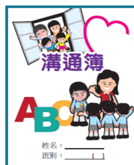
圖 5.3b 「溝通簿」示例

ABC App為最新校本開發的手機互動系統，方便家長及學生透過流通裝置瀏覽及跟進學生學習進程。