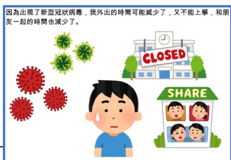
圖 5.3c 「情境解讀故事」示例