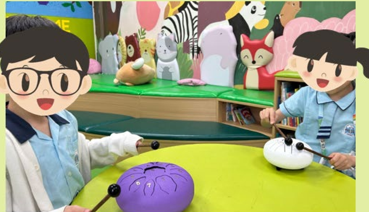
音樂Do Re Me