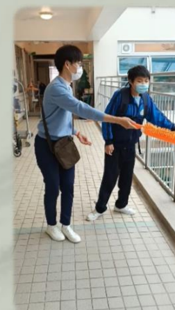
定向行走訓練， 由宿舍步行至訓練室