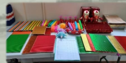
家長可借用教具，在假期中使用