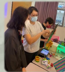
與支援學校老師 分享教具