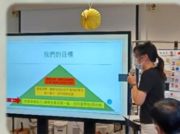
向支援學校進行交流分享會