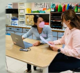
資源教師與專責同工交流