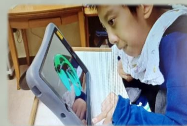
運用 iPad 進行手眼協調訓練